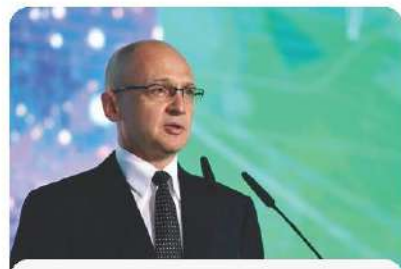
Кириенко Сергей Владиленович

Первый заместитель Руководителя Администрации Президента Российской Федерации